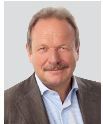
Frank Bsirske ver.di-Vorsitzender

Das ist kein Ergebnis, das Freude und Euphorie auslöst, aber es enthält strukturelle Verbesserungen gegenüber der Schlichtungsempfehlung vom Juni. Es ist bedauerlich, dass die Arbeitgeber nicht bereit waren, insbesondere die wichtige Arbeit der Sozialarbeiter – auch angesichts ihrer aktuell schwierigen Tätigkeiten in der Flüchtlingshilfe – ausreichend zu würdigen. Das ist leider auch Ausdruck des Kräfteverhältnisses. Aber ich werde bei den Mitgliedern für die Annahme werben.